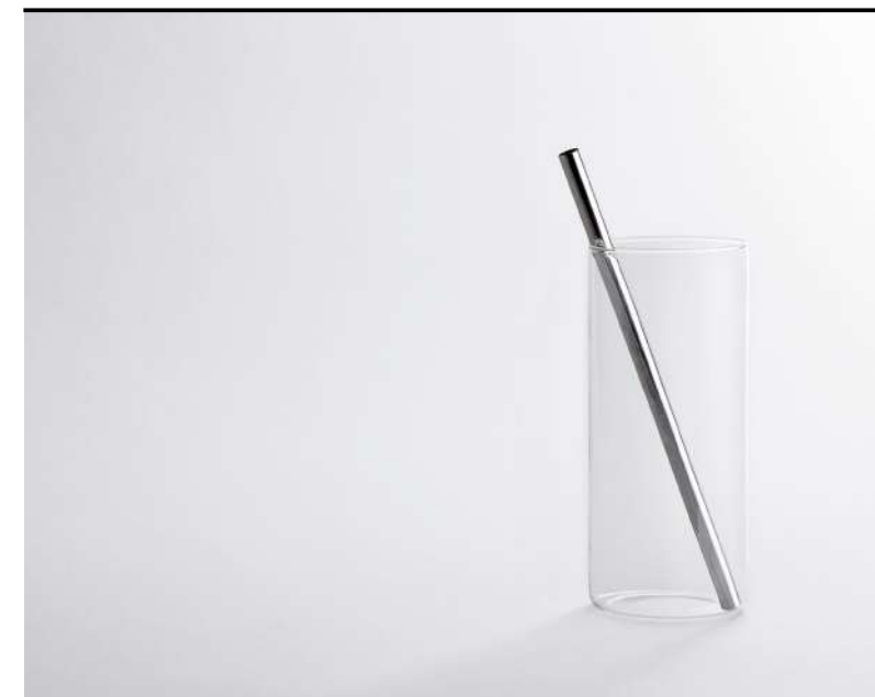
Bibita Highball, Saft