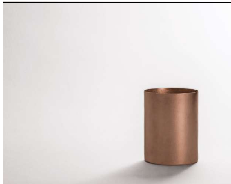
Moscow mule rame Mule copper mug, Mule Kupferbecher