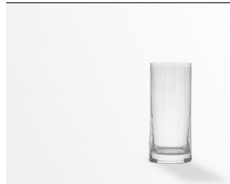
Bibita Quadri highball, Soft