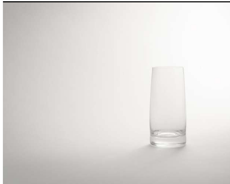
Tumbler highball Highball, Soft