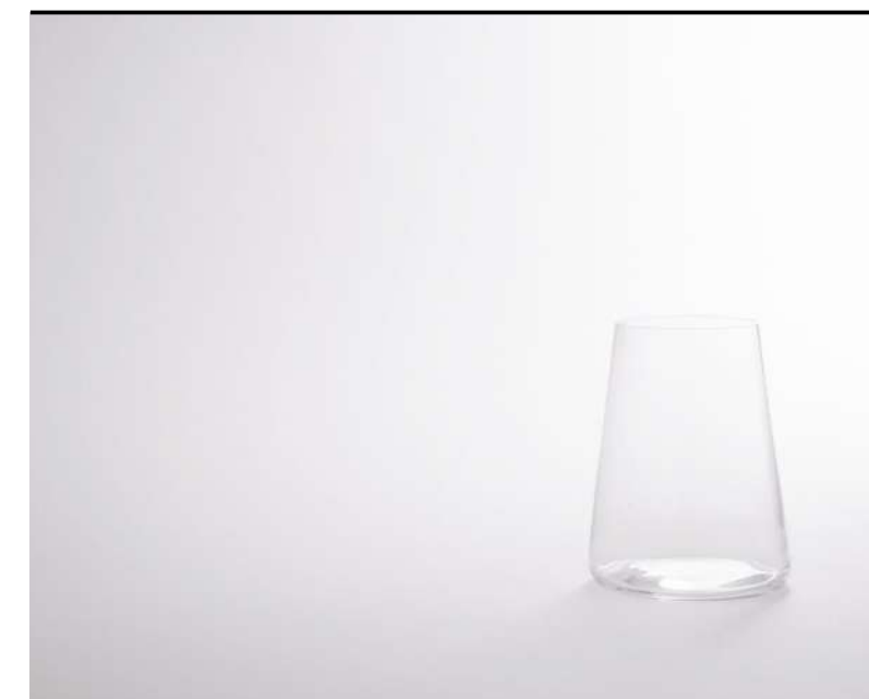
Point Tumbler Tumbler, Tumbler