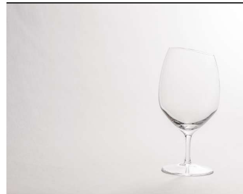
Vino rosso Red wine, Rotwein