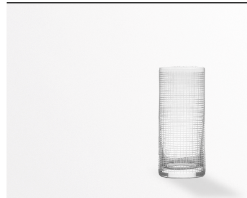
Bibita Righe highball, Soft