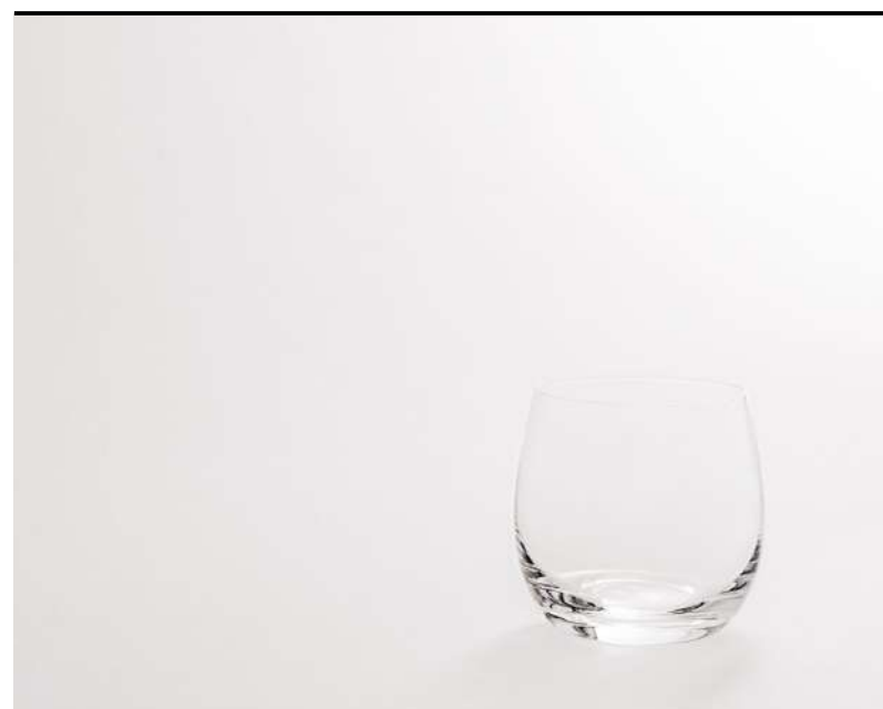
Tumbler medio Medium tumbler, Tumbler, mittel