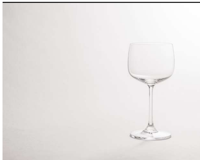
Vino rosso Red wine, Rotwein