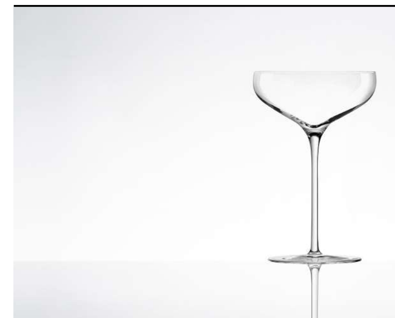
Coppa Champagne Champagne Saucer, Champagnerschale