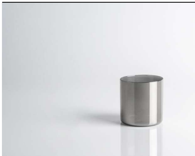
Tumbler grande Large tumbler, Tumbler, groß