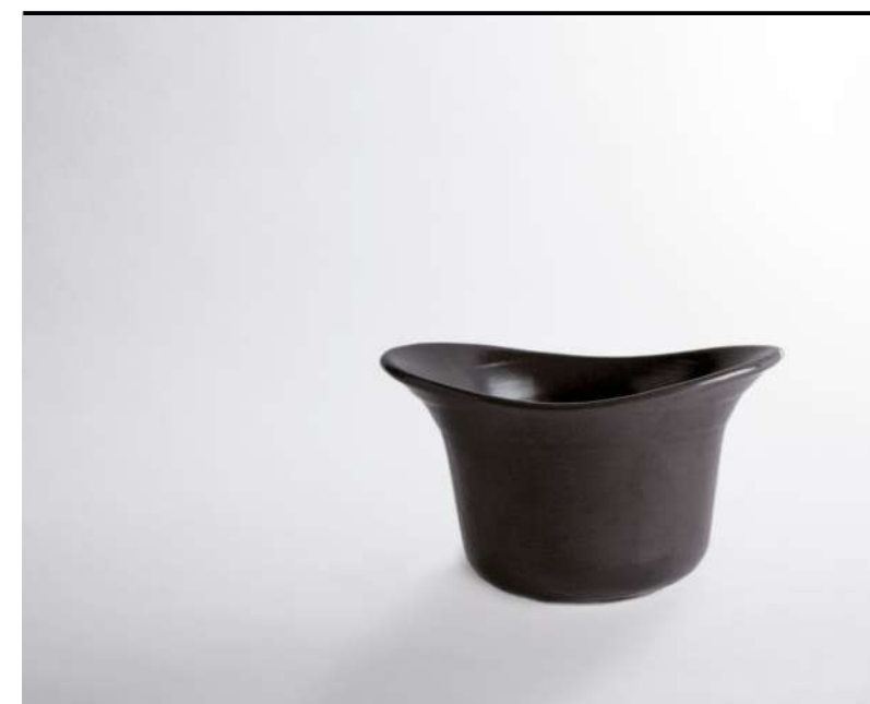
Assiette D'O grès ciotola, bowl, schale