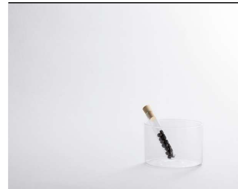
Mixology Small tumbler, Tumbler klein