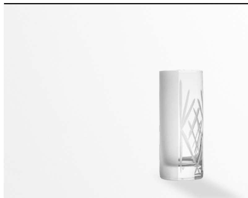
Tumbler opaco/trasparente sandblasted/transparent tumbler