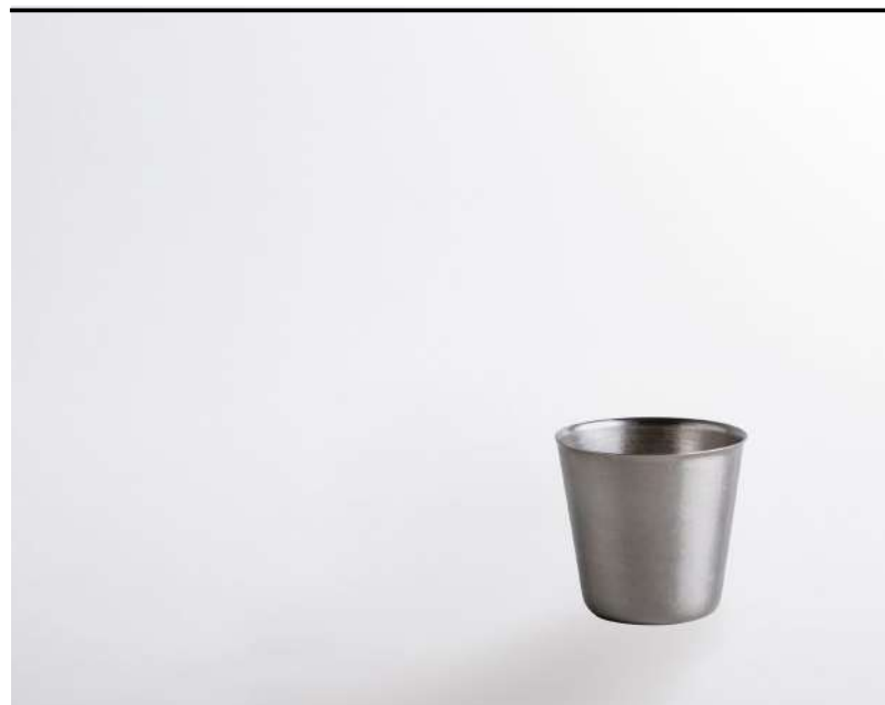
Sweet dream bicchiere in acciaio, stainless steel glass,