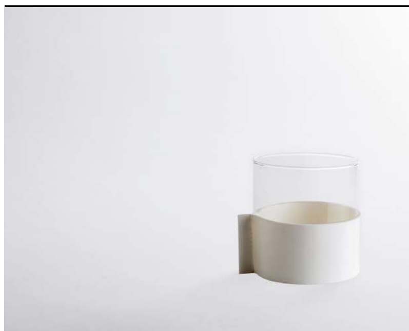
Hot drink vetro e silicone, glass and silicon,