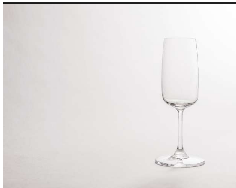
Flûte Flûte, Sekiflûte