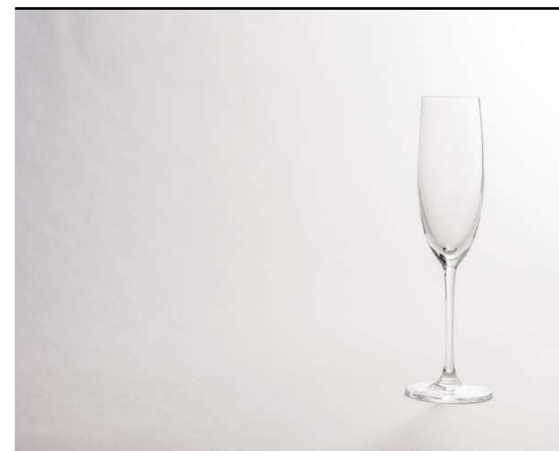
Flûte Flûte, Sekflûte