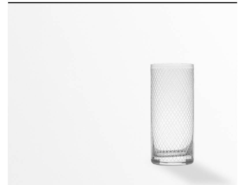
Bibita Rombi highball, Soft