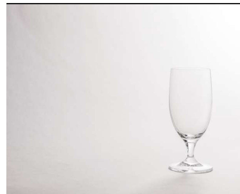
Birra/Succo Beer/Juice, Bier/Soft