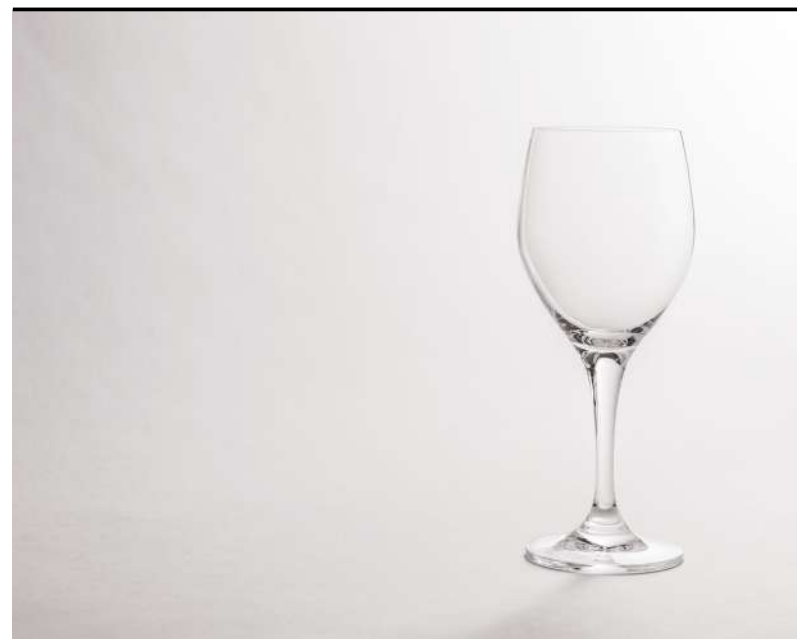
Vino rosso Red wine, Rotwein