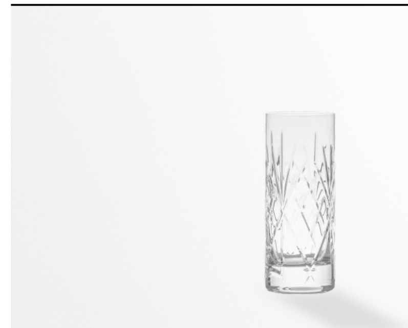
Tumbler molato satinato cut glass tumbler sandblasted