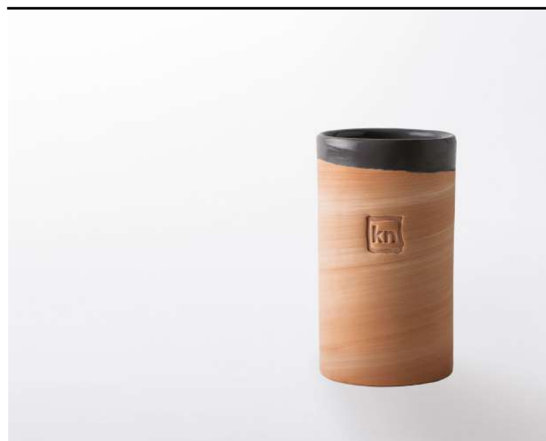
Cast away bicchiere n terracotta, terracotta glass