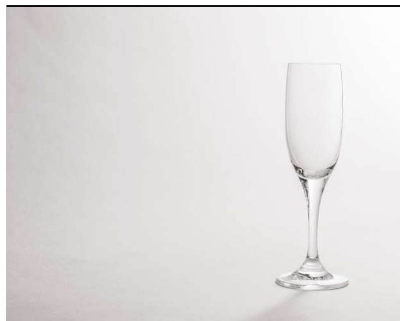
Flûte Flûte, Sektflûte