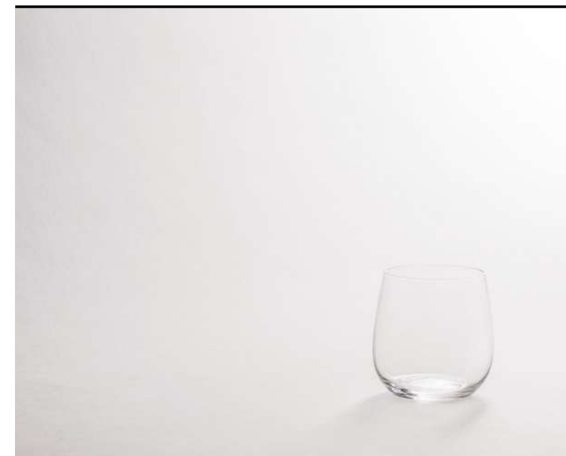
Tumbler Tumbler, Tumbler