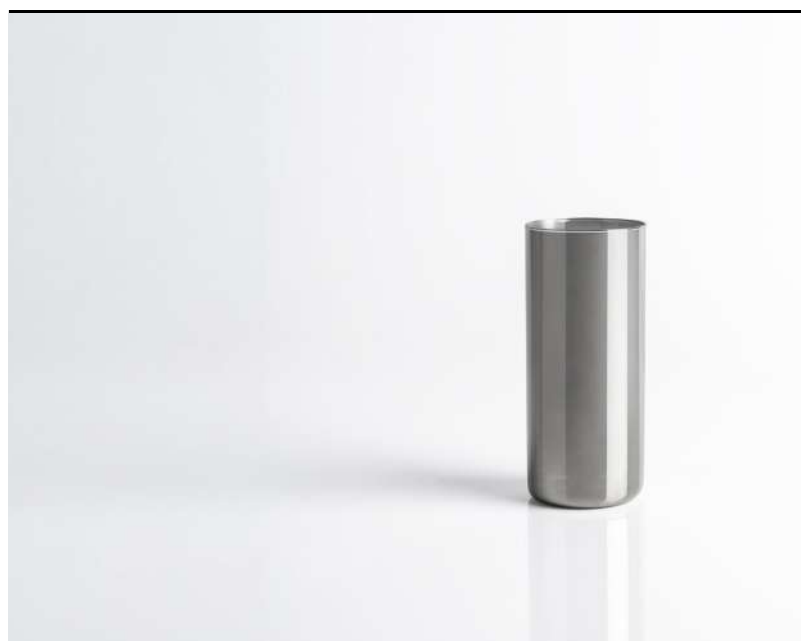
Tumbler basso Small tumbler, Tumbler, klein