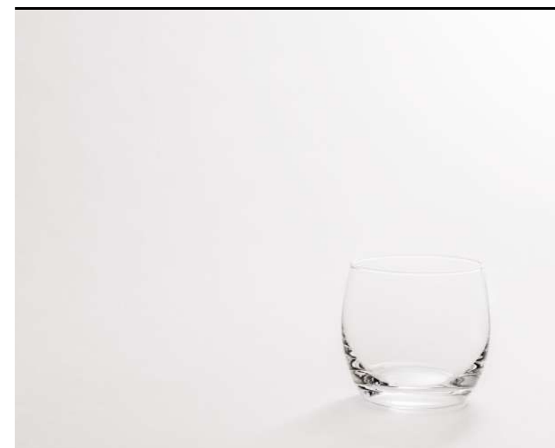
Tumbler basso Small tumbler, Tumbler, klein