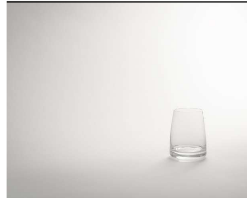
Tumbler piccolo Small tumbler, Tumbler klein