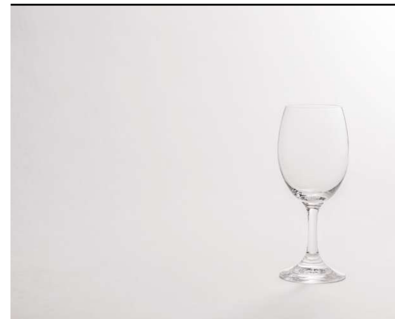
Vino bianco White wine, Weisswein