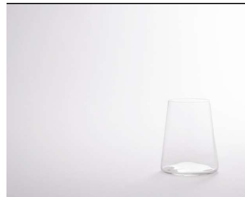
Point Tumbler Tumbler, Tumbler