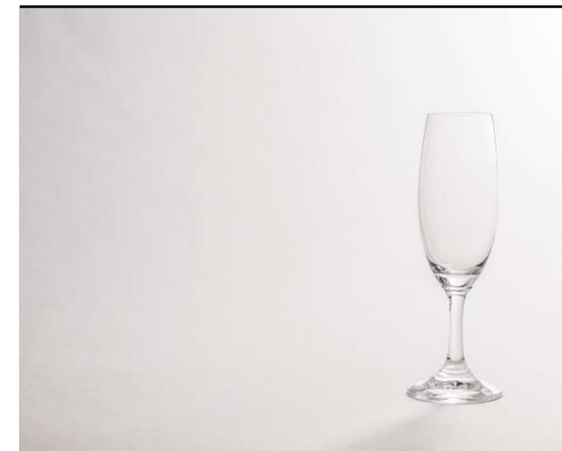
Flûte Flûte, Sektflûte