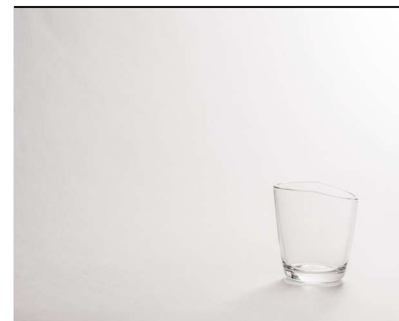
Acqua Water, Wasser