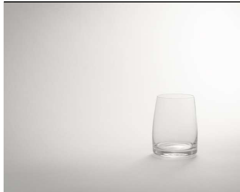
Tumbler Whisky DOF