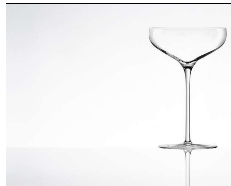
Coppa Champagne Champagne Saucer, Champagnerschale