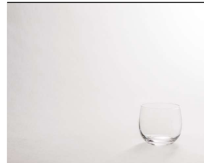
Tumbler Basso Small tumbler, Tumbler, klein