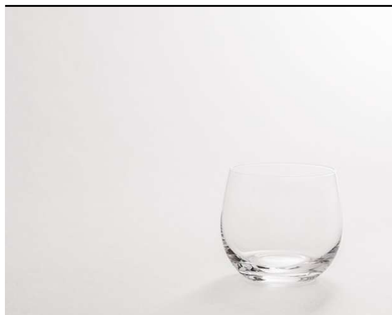
Tumbler grande Large tumbler, Tumbler, groß